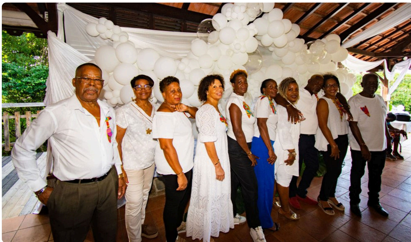
Le Foyer rural de Morne Pitault. • A.P.