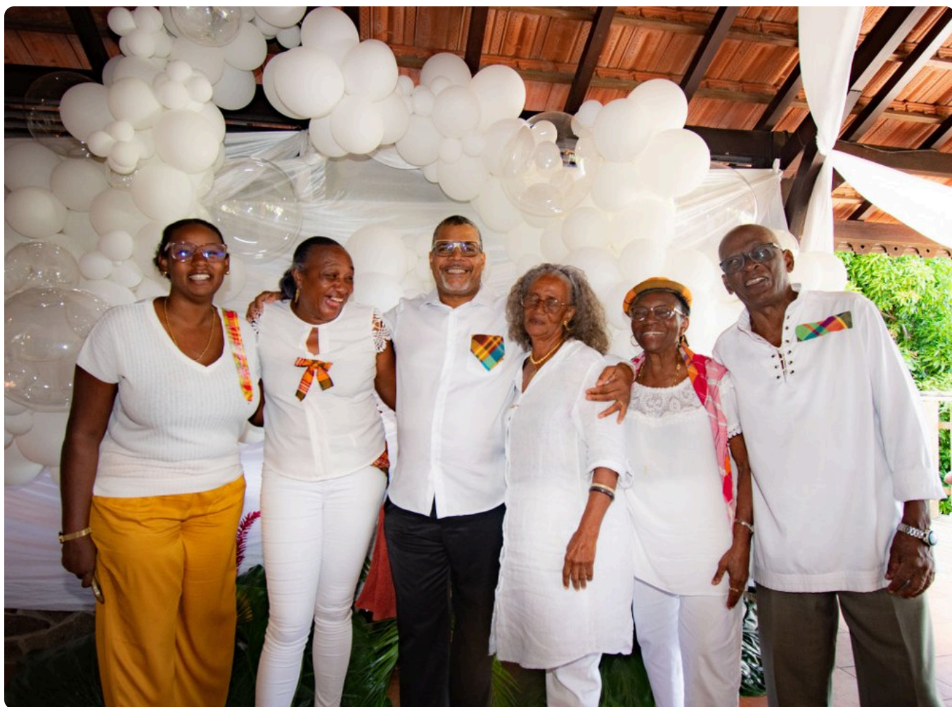
Les membres foyer rural de Chopotte. • A.P.