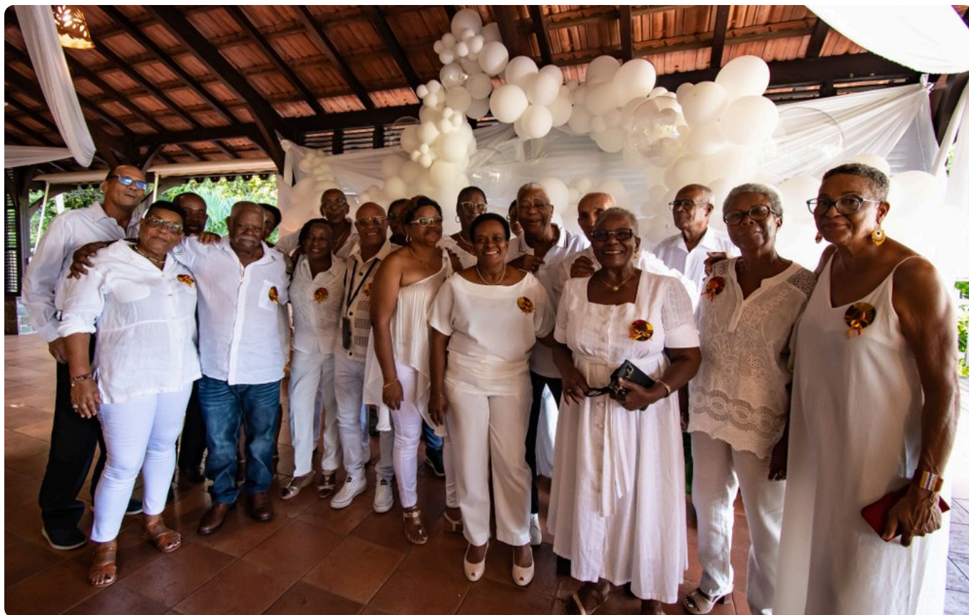
La manifestation a été possible grâce aux dons de nombreux partenaires et à la mobilisation des foyers ruraux, sur notre photo les membres de Morne Acajou.