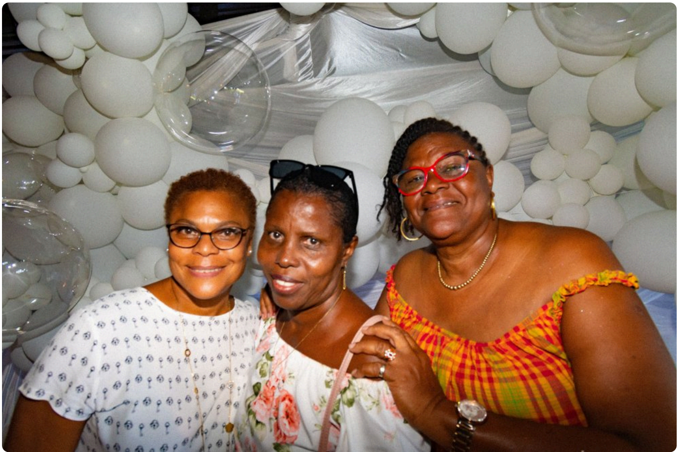
Foyer la Dumaine • A.P.