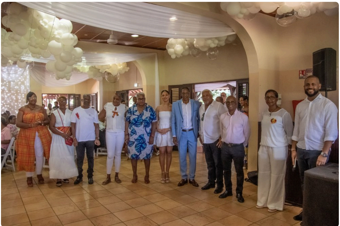
Le maire du François entouré des organisateurs et de membres de son conseil municipal. • A.P.