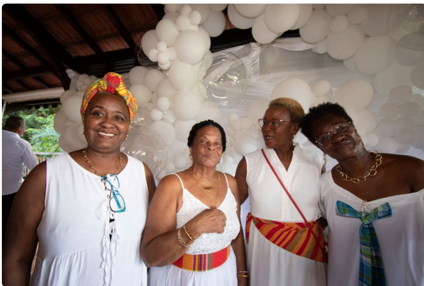
La manifestation a permis de débiter l'année par une note convivialité. Ici les membres du Foyer de Perriolat.