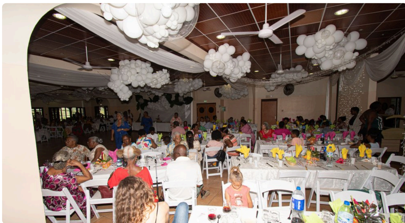
Cette première édition des « Déjeuners du cœur » a réuni près de 250 convives. • A.P.

En ce jour de l'Épiphanie, traditionnellement associé au partage et à la rencontre, cette initiative a pris une résonance toute particulière. Bien au-delà d'un repas, ce déjeuner du cœur a offert un temps de reconnaissance, de chaleur humaine et de fraternité.